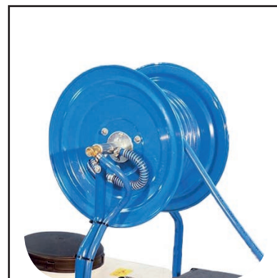
Tubo alta pressione mt 50 con avvolgitubo