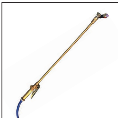
Esclusivo kit lancia con ugello nebbia per una migliore nebulizzazione della soluzione sanificante negli ambienti .